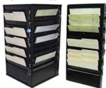
FC-1548 24 crochets

CROCHETS DISPONIBLES sur commande spéciale pour tous supports muraux